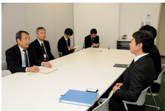
静岡労働局長・清水公共職業安定所所長との意見交換会

交付式後の、静岡労働局長と清水公共職業安定所所長との意見交換会では、ユースエール認定までの経緯や当社の働き方への取組みについて、積極的に意見交換が行われました。