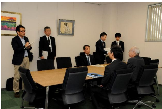
新聞記者の方から取材を受ける様子